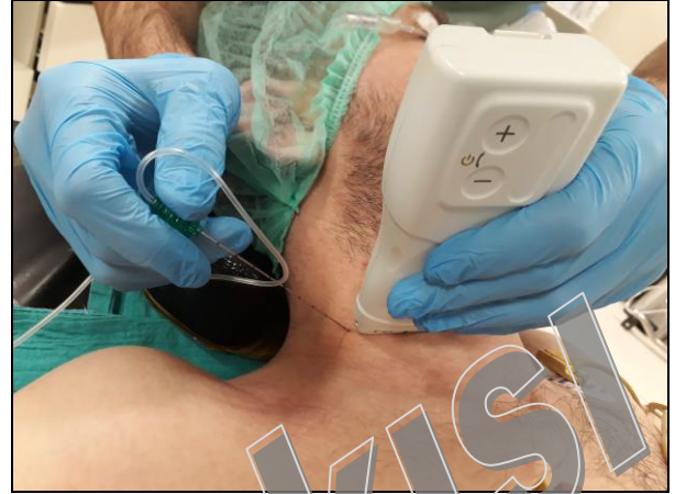
Resim 1. Interskalen brakial pleksus blok yapılışı.

Blok planlanan hastalara premedikasyon uygulanmadı. Hastaların işlem öncesi ve sonrası monitörizasyonu ile; kalp hızı, non-invaziv olarak sistolik, diyastolik ve ortalama arteriyel basınç ölçümü, 3' lü EKG elektrodu (DII derivasyon) ile kardiyak takip ve pulse oksimetri ile periferik oksijen satürasyon ölçümü yapıldı. Hastalar supin pozisyona alınarak, omuz 45° yükseltildi, baş ise işlem yapılacak tarafın karşısına çevrildi (Resim 1).