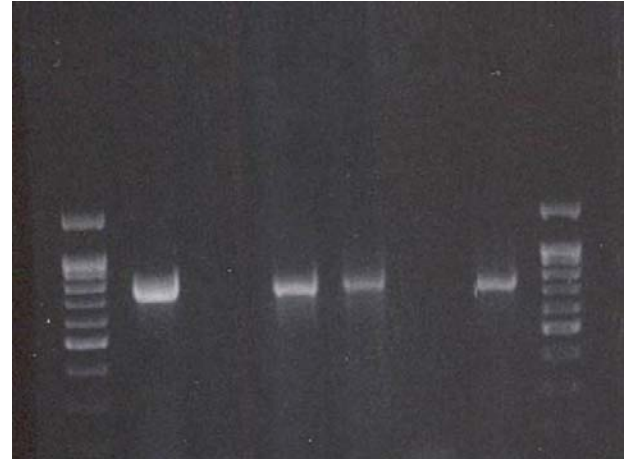
Şekil-1; PCR ürünlerinin %2'lik agaroz jel göç motifleri. M; 100 bp'lik DNA ladder ağırlık markeri (Bio Basic Inc., Canada), hat 1; pozitif kontrole ait 760 bp'lik bant (standart E. Coli kültüründen elde edilen DNA), hat 2; DNA ekstraksiyonu için negatif kontrol (steril dH 2 O), hat 3,4,6; rat dokularından yapılan PCR sonucu 760 bp'lik bant yönünden pozitif bulunan örnekler ve hat 5; rat dokularından yapılan PCR sonucu 760 bp'lik bant yönünden negatif bulunan örnek.

Bu çalışmada pozitif kontrol olarak, geleneksel yöntemler ile kültürde E. Coli olduğu belirlenen bakteriden elde edilen DNA ve negatif kontrol olarak ise steril dH 2 O kullanıldı. PCR'ın duyarlılığı, pozitif kontrol olarak kullanılan E. Coli DNA'sının 10 katlık dilüsyonlarından hazırlanan örneklerin PCR'ının yapılmasıyla belirlendi. Yanlış pozitiflik ve negatifliği önlemek için, deneyin her aşamasında pozitif ve negatif kontroller kesinlikle kullanılarak, steril kabinlerde çalışıldı.